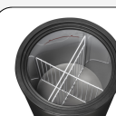
Ensemble de rondelles d'espacement inclus