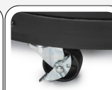
Roulettes pour positionnement facile