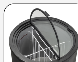
Couvercle supérieur en verre trempé